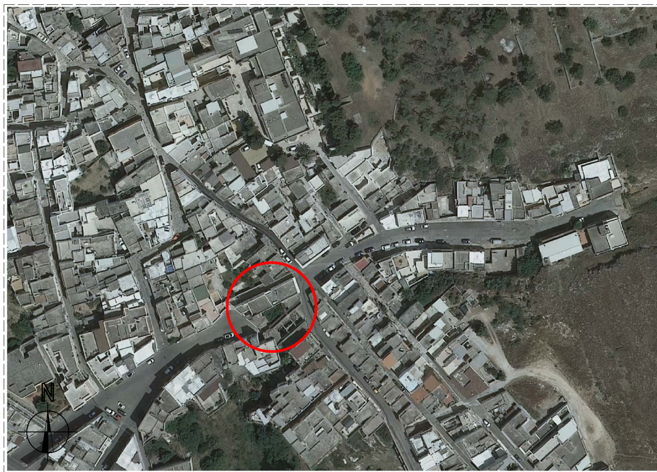
STRALCIO COREOGRAFIA 1:1000